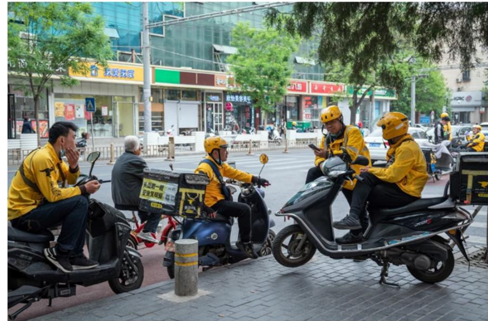
Food delivery couriers for Meituan gather around motorcycles in Beijing on April 21.